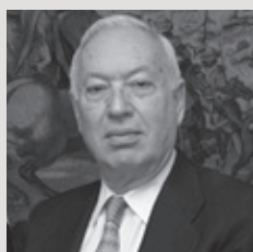
José Manuel GARCÍA-MARGALLO